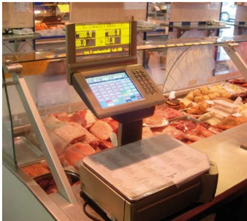
SM-880 im Laden der Fa. Lackinger in Linz